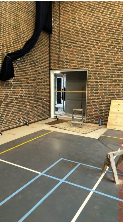
Doorgang van de gymzaal naar de hal met nieuwe vergaderruimte, kleedkamers en toiletten