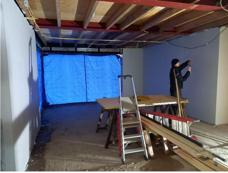
Nieuwe vergaderruimte met een grote raampartij welke uitzicht biedt op de weide