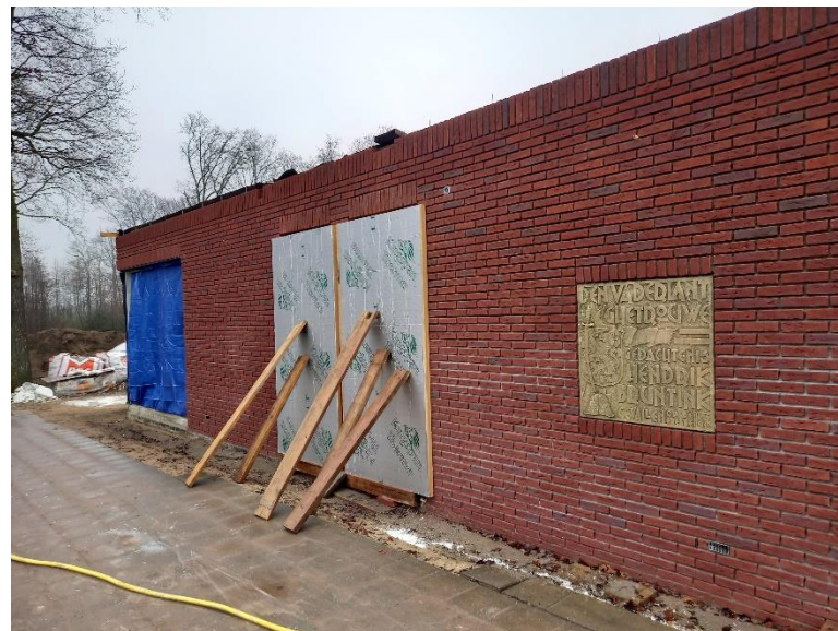
De nieuwe buitenmuur aan de zijde van de dieren met het ingemetselde monument