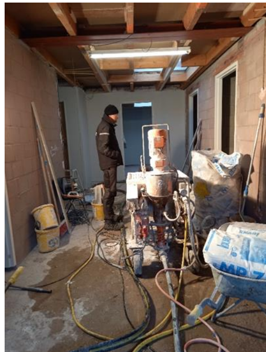
Nieuwe hal met links een kleedkamer en rechts een kleedkamer en toiletten